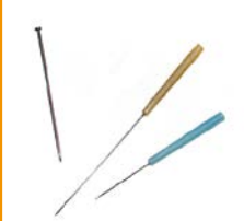
Akupunkturnadeln im Vergleich zu einer Stecknadel